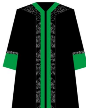
Toga jabatan Dekan Fakultas Tarbiyah dan Ilmu Keguruan