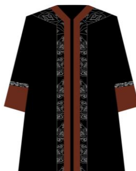
Toga jabatan Dekan Fakultas Dakwah dan Komunikasi Islam