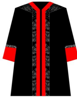
Toga jabatan Direktur Pascasarjana