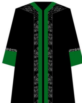
Toga jabatan Rektor dan Wakil Rektor