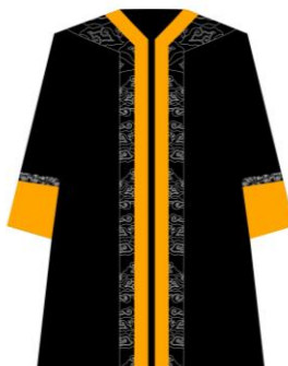
Toga jabatan Dekan Fakultas Ekonomi dan Bisnis Islam