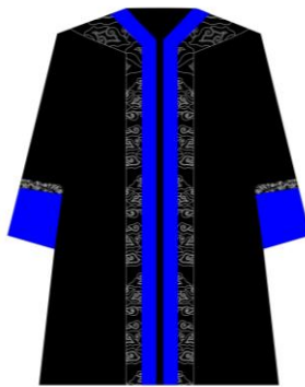
Toga jabatan Dekan Fakultas Ushuluddin dan Adab