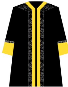
Toga jabatan Profesor