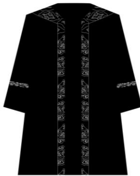
Toga jabatan Dekan Fakultas Syari'ah