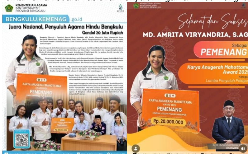
Gambar 3.3 Berita Terkait Juara nasional Penyuluh Agama Hindu Bengkulu

Capaian kinerja sebesar 120% pada indikator persentase penyuluh agama dengan nilai kinerja berkategori baik menunjukkan bahwa kualitas layanan keagamaan telah melampaui target yang ditetapkan. Hal ini mencerminkan meningkatnya profesionalisme dan akuntabilitas penyuluh agama melalui kedisiplinan laporan harian, pemanfaatan konten digital keagamaan yang memperluas jangkauan layanan secara inklusif, serta dukungan kediklatan yang efektif dalam meningkatkan kompetensi. Pencapaian ini berdampak positif pada terwujudnya layanan keagamaan yang lebih responsif, adaptif, dan berorientasi pada kebutuhan masyarakat.