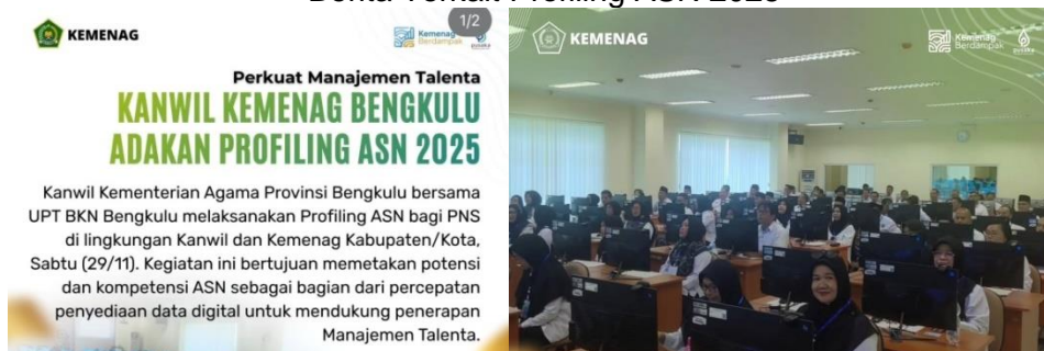
Gambar 3.10 Berita Terkait Profiling ASN 2025

Capaian kinerja 101% menunjukkan bahwa pengelolaan ASN telah melampaui target yang ditetapkan, mencerminkan efektivitas kebijakan pengadaan dan penempatan pegawai yang tepat, serta pelaksanaan pembinaan dan pengembangan kompetensi yang berkelanjutan. Pencapaian tersebut turut mendukung peningkatan kinerja organisasi dan kualitas pelayanan publik secara keseluruhan.