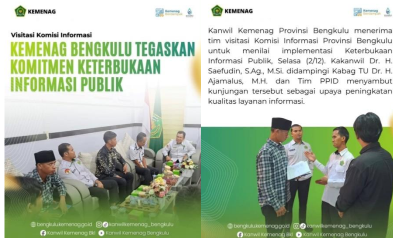
Gambar 3.11 Berita Terkait Komitmen Keterbukaan Informasi Publik

18.2 Persentase peningkatan jumlah konten keagamaan dan pendidikan yang dipublikasi. Capaian kinerja 99%, yang menunjukkan peningkatan signifikan dalam penyediaan dan diseminasi informasi kepada publik, meskipun masih terdapat ruang perbaikan untuk mencapai target secara optimal. Secara keseluruhan, capaian ini mendukung terwujudnya layanan informasi dan dokumentasi yang transparan, akuntabel, dan responsif terhadap kebutuhan masyarakat.