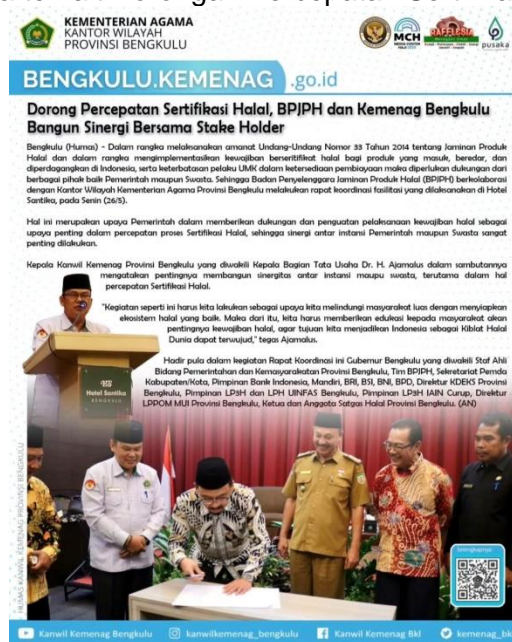
Gambar 3.4 Berita terkait Dorongan Percepatan Sertifikat Halal

2.11 Persentase jumlah calon penerima dana sosial keagamaan terintegrasi basis data terpadu nasional