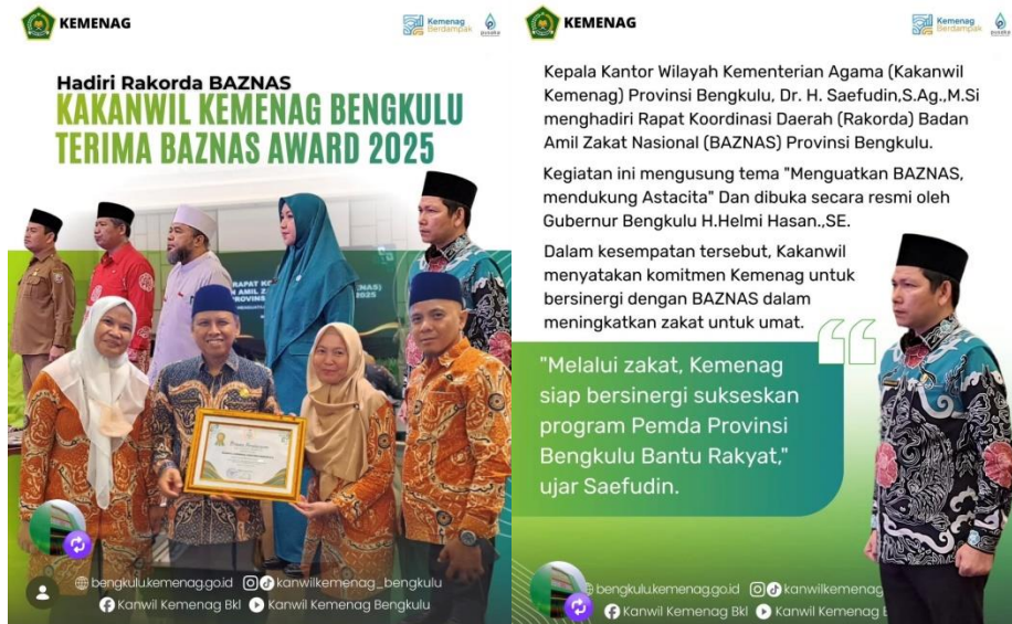
Gambar 3.5 Berita Terkait Penerima BAZNAS Award 2025

2.13 Persentase Lembaga dana sosial keagamaan/Zakat yang sesuai prinsip syariah, akuntabel, dan professional