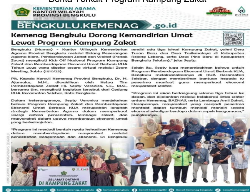
Gambar 3.6 Berita Terkait Program Kampung Zakat