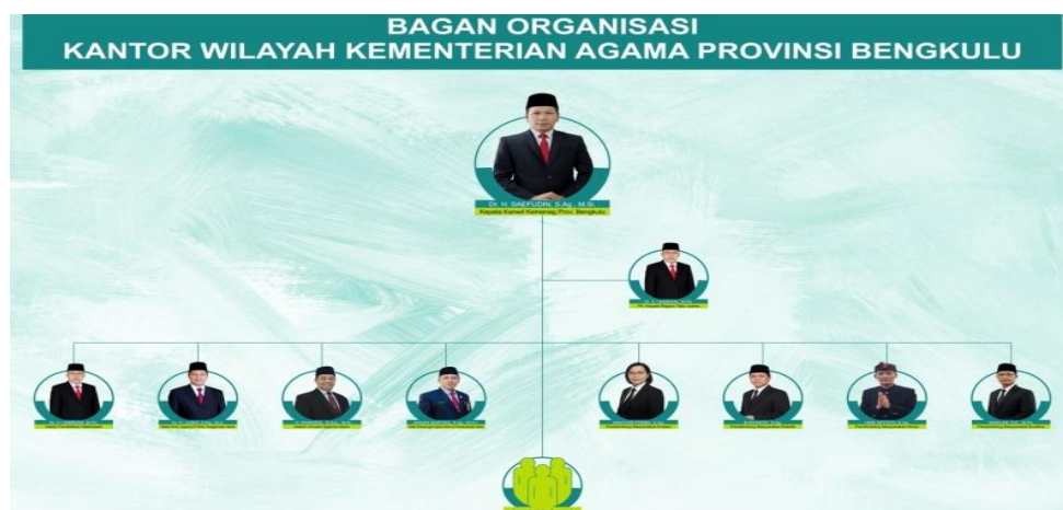
Gambar 1.1 Struktur Organisasi Kantor Wilayah Kementerian Agama Provinsi Bengkulu

Berdasarkan Peraturan Menteri Agama Nomor 6 Tahun 2022 tentang Perubahan Atas Peraturan Menteri Agama Nomor 19 Tahun 2019 tentang Organisasi dan Tata Kerja Intansi Vertikal Kementerian Agama, Susunan Organisasi Kantor Wilayah Kementerian Agama Provinsi Bengkulu yakni: