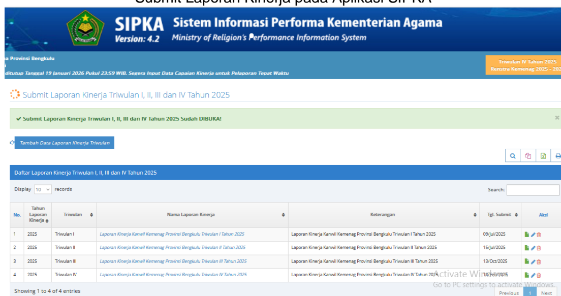
Gambar 3.9 Submit Laporan Kinerja pada Aplikasi SIPKA

Capaian kinerja 100% menunjukkan bahwa kualitas penyusunan laporan kinerja satuan kerja telah sesuai target yang ditetapkan. Capaian ini mencerminkan meningkatnya pemahaman dan kepatuhan satuan kerja terhadap standar pelaporan kinerja, serta efektivitas pembinaan dan pengendalian dalam penerapan Sistem Akuntabilitas Kinerja Instansi Pemerintah (SAKIP).