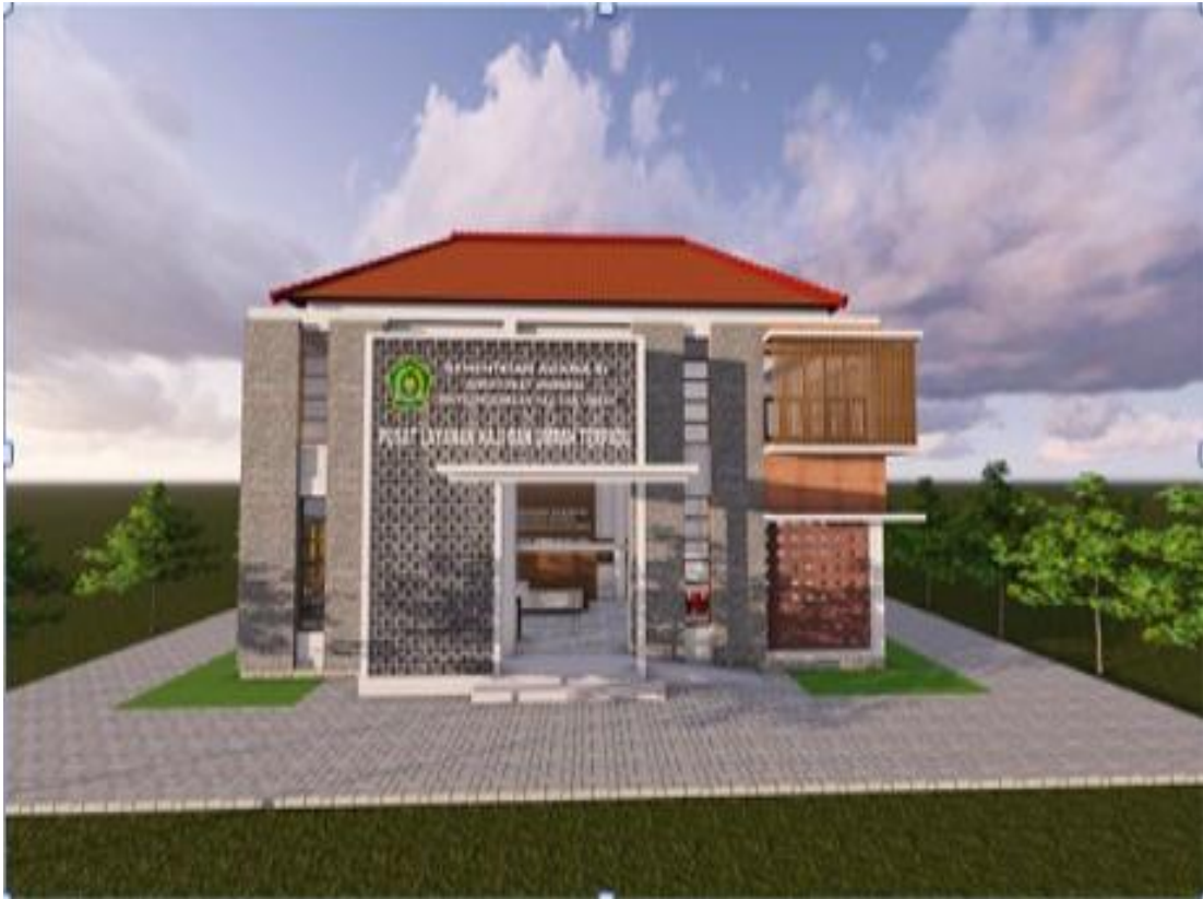
Desain Bangunan PLHUT yang Dibangun Tahun 2020

Saat ini Pusat Layanan Haji dan Umrah Terpadu (PLUHT) dalam proses pembangunan fisik dan insyaallah akan selesai akhir tahun 2020 ini.