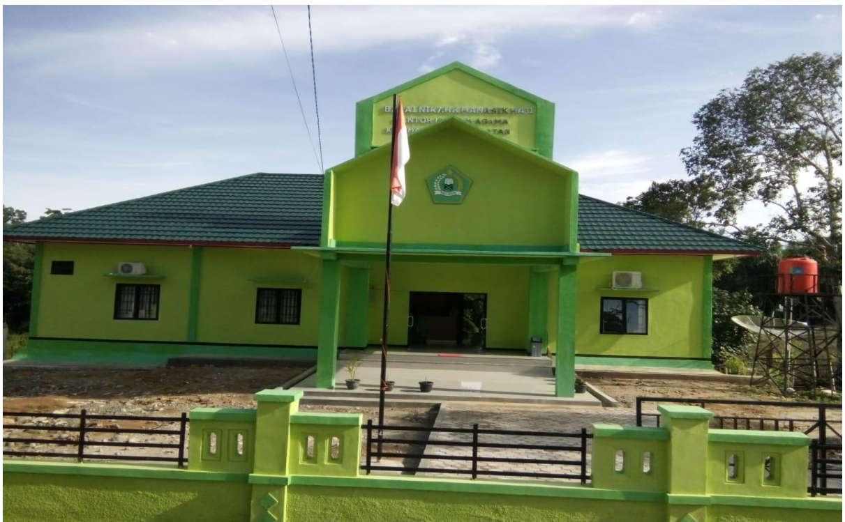
Gedung Balai Nikah dan Manasik Haji Kecamatan Kaur Selatan Kabupaten Kaur