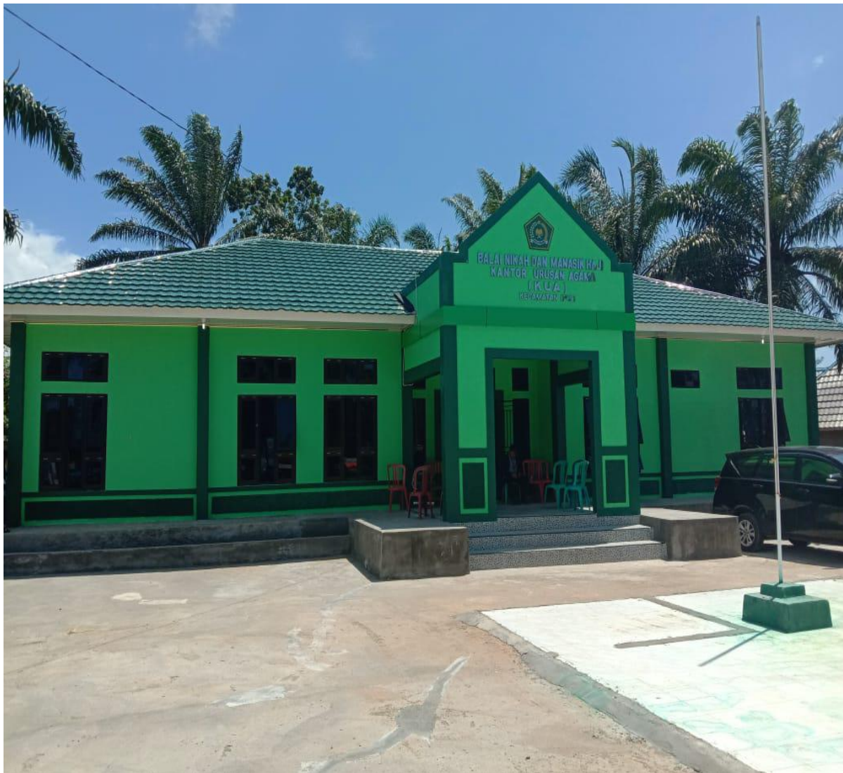
Gedung Balai Nikah dan Manasi Haji Kecamatan Ipuh Kabupaten Mukomuko