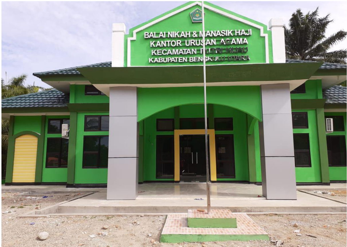
Gedung Balai Nikah dan Manasik Kecamatan Putri Hijau Kabupaten Bengkulu Utara