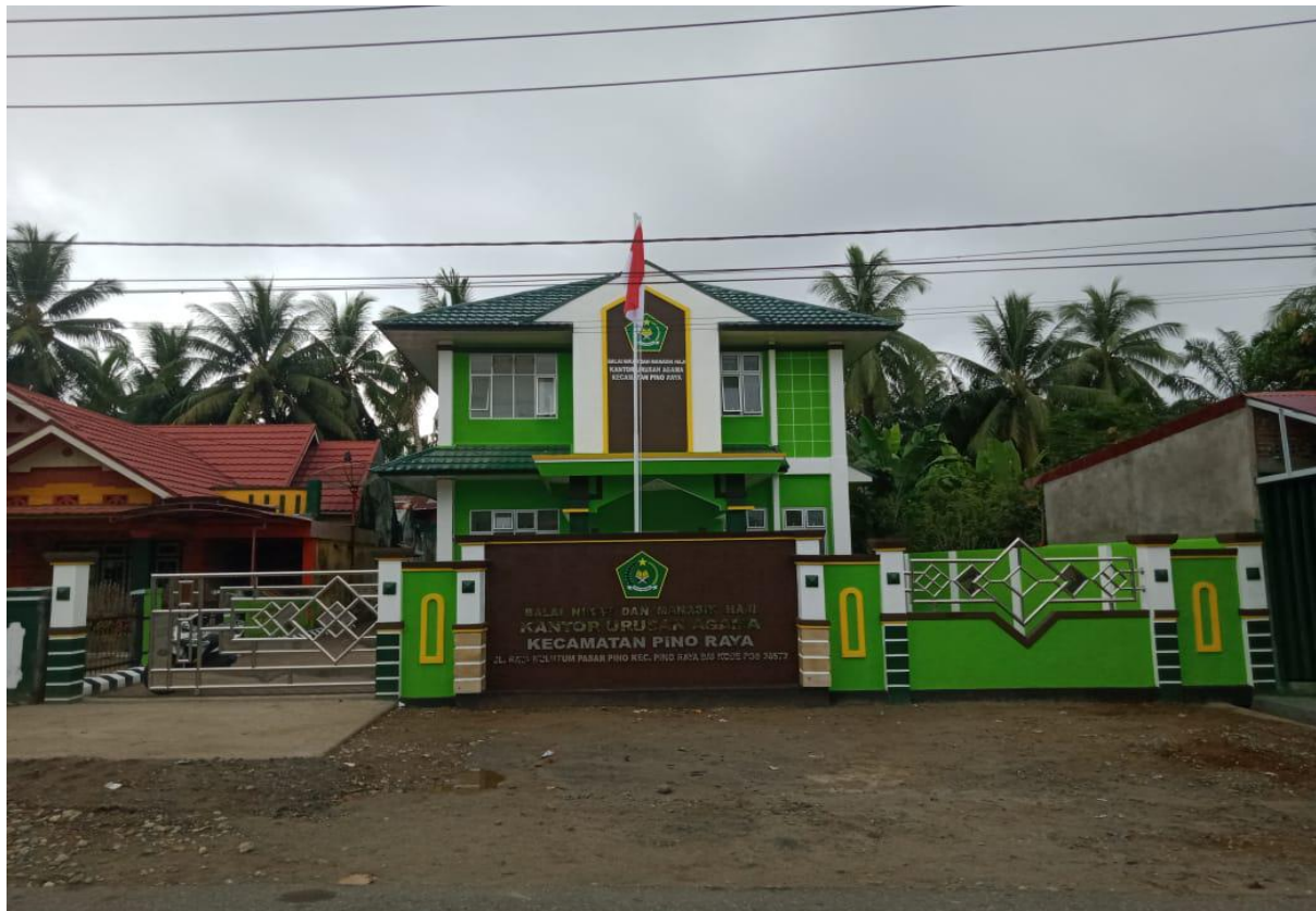
Gedung Balai Nikah dan Manasik Haji Kecamatan Pino Raya Kabupaten Bengkulu Selatan