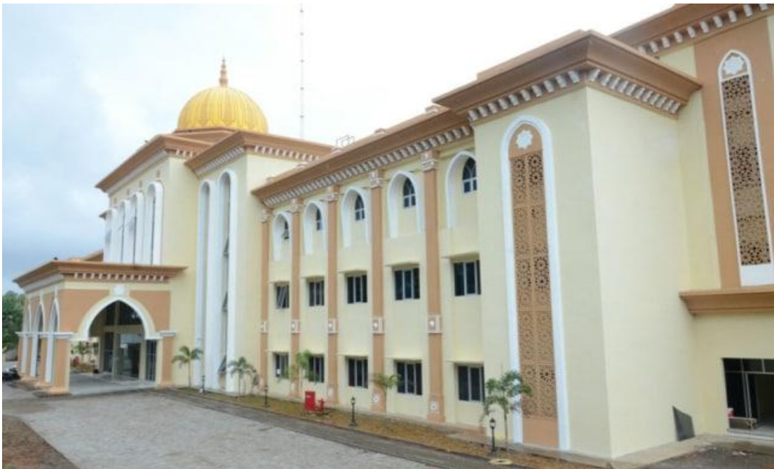
Gedung Revitalisasi Asrama Haji tahun 2016

Tahun 2020 ini Bengkulu juga akan merevitalisasi asrama haji dengan alokasi anggaran Rp. 53.453.000.000 (lima puluh tiga milyar empat ratus lima puluh tiga juta rupiah) yang terdiri dari 1 unit gedung asrama dan 1 unit fasilitas penunjang berupa masjid.