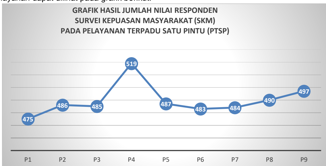
Grafik 1 Jumlah Nilai Responden Tentang Pelayanan pada Kanwil Kementerian Agama Provinsi Bengkulu Semester 2 Tahun 2021

Berdasarkan hasil perhitungan pada Lampiran Laporan Survei Kepuasan Masyarakat Semester II ini, jumlah nilai responden dari 9 pertanyaan tentang unsur pelayanan dapat dilihat pada grafik berikut: